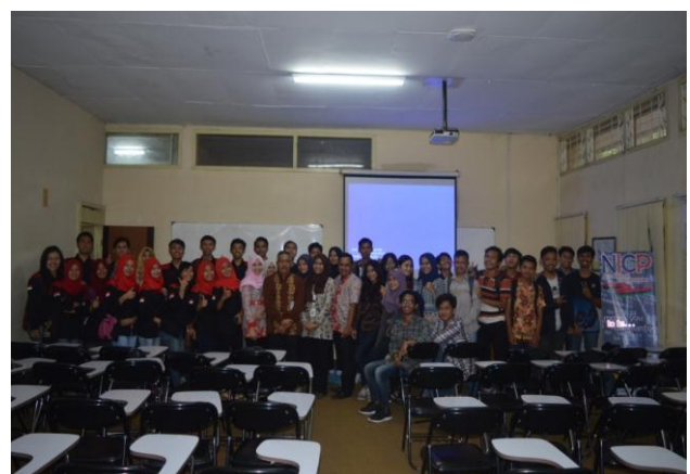
Gambar 3. Peserta Batch pertama Program NICP