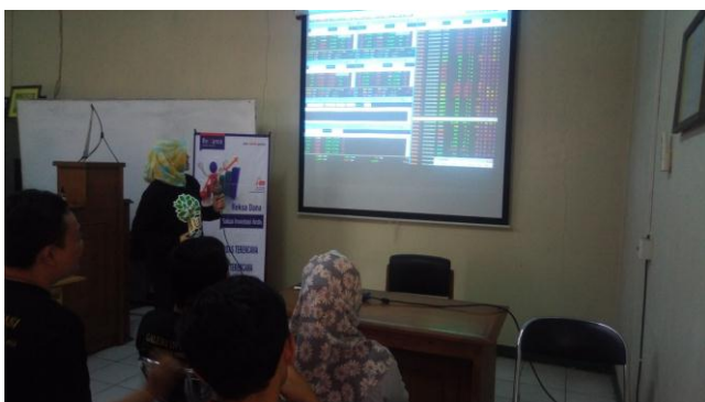
Gambar 5. Materi Pengenalan Simulasi Perdagangan Saham di Bursa Efek Indonesia

Hasil nyata dalam kegiatan praktek perdagangan saham di Bursa Efek