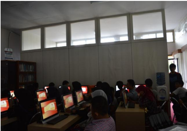
Gambar 1. Kuliah Umum Pasar modal di GIBEI-FE UNSIL-RELI

Literasi yang dilakukan adalah melalui kegiatan kuliah umum dimana dalam kuliah umum ini mampu menangkap peluang investor dan calon investor serta pengenalan pasar modal kepada kalangan masyarakat.