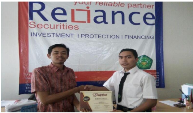
Gambar 6. Penyerahan Sertifikat Program NICP