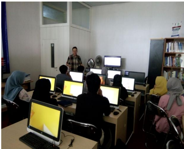
Gambar 4. Pengenalan Materi Pasar Modal pada peserta NICP