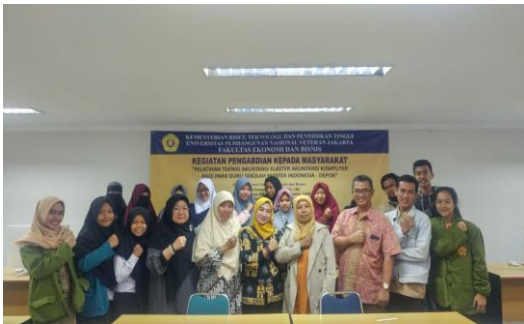
Gambar 3.1 Foto Dokumentasi Pelaksanaan Kegiatan PPM