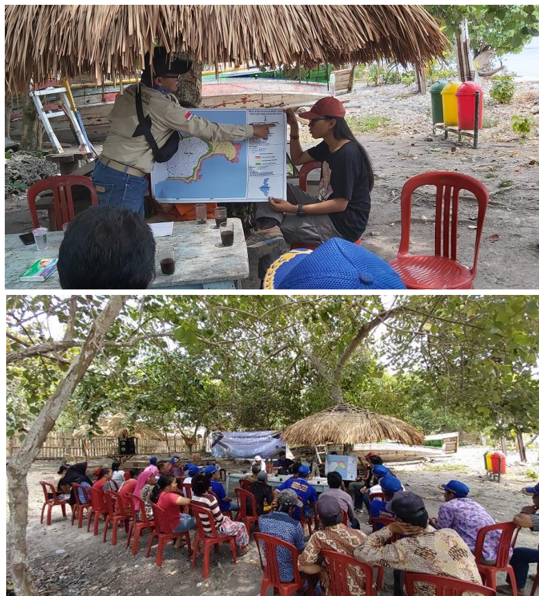
Gambar 2. FGD pemetaan partisipatif kerentanan bencana tsunami

menghadapi bencana. Hal tersebut dapat memberikan pengaruh positif terutama bagi kelompok rentan untuk memahami tingkat kerentanan dan kapasitas lokal di Desa Pagar Jaya. Persepsi ini kemudian menjadi pedoman pengurangan risiko bencana tingkat desa yang selalu dihadapkan pada faktor ekologi dan sosial yang dinamis dan tidak menentu (Cadag and Gaillard, 2012). Implementasi rencana tanggap darurat (Gambar 2) disampaikan melalui dua konsep dasar yaitu : (1) Pengembangan skenario dampak dan kejadian tsunami, dan (2) Sistem peringatan dini partisipatif. Peran penting kelompok sadar wisata (Pokdarwis) di Desa Pagar Jaya menunjukkan besarnya partisipasi komando dalam mengkoordinasikan sistem penanggulangan bencana. Hal ini terwujud dalam sistem peringatan dini yang dikembangkan dari potensi dan kearifan lokal.