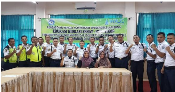
Gambar 1. Edukasi Hidrasi Pada pekerja Satuan Pengaman (Satpam) di lingkungan Universitas Lampung

Gambaran peserta kegiatan ini adalah pekerja Satuan Pengaman (Satpam) di lingkungan Universitas Lampung, namun juga Tim Kesehatan Universitas Lampung. Jumlah peserta kegiatan ini diikuti oleh 34 orang. Pelaksanaan pemberian edukasi dilakukan dalam 2 (dua) hari.