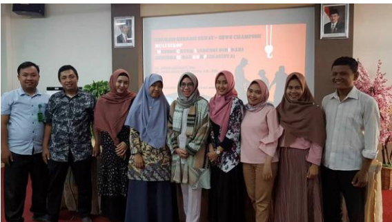
Gambar 2. Edukasi Hidrasi Pada Tim Kesehatan di lingkungan Universitas Lampung

Sebelum dilakukan pemberian edukasi, seluruh peserta menjawab pretest, sebagai evaluasi penilaian keberhasilan peningkatan pengetahuan setelah pemberian edukasi.